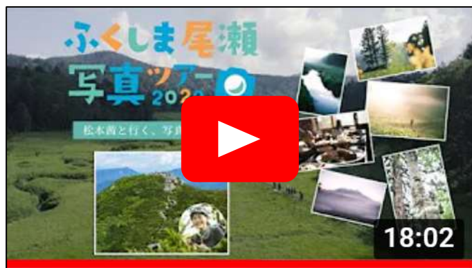
地域の誘客プロモーション事例／ふくしま尾瀬(福島県)

『山と溪谷Ch.』では、企業・自治体等のPRを、YouTube動画内に入れ込むタイアップ企画をご提案しています。タイアップの仕方は様々ありますが、登山好きのチャンネル登録者に刺さる内容をご提案しますので、ぜひ動画でのプロモーションをご検討ください。