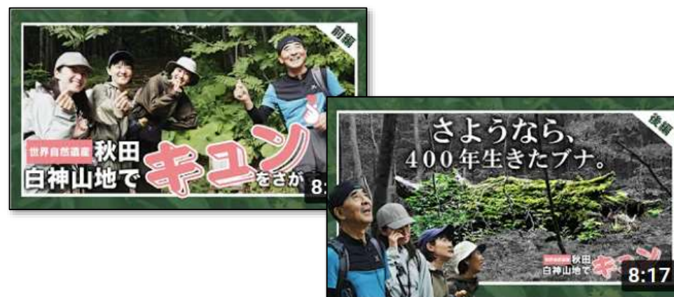
地域の誘客プロモーション／秋田白神山地(秋田県)