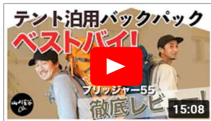
ミステリーランチ テント泊用バックパックベストバイ