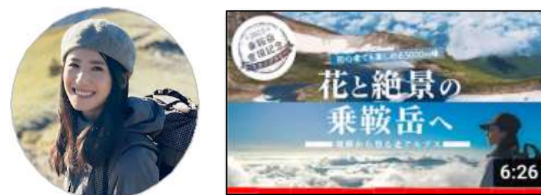
オトナ女子の山登り／【北アルプス乗鞍岳】2時間で3000mの頂へ。1泊2日で星空もご来光も雲海も…