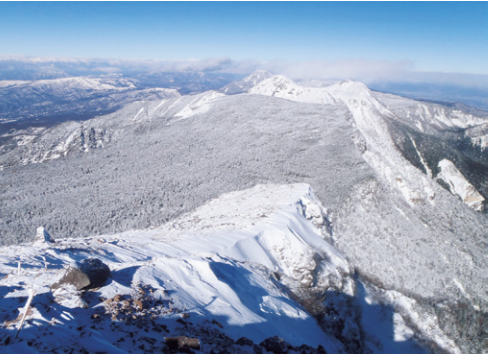
硫黄岳山頂から北側の展望。中央の双耳峰が天狗岳で左後ろが藝科山