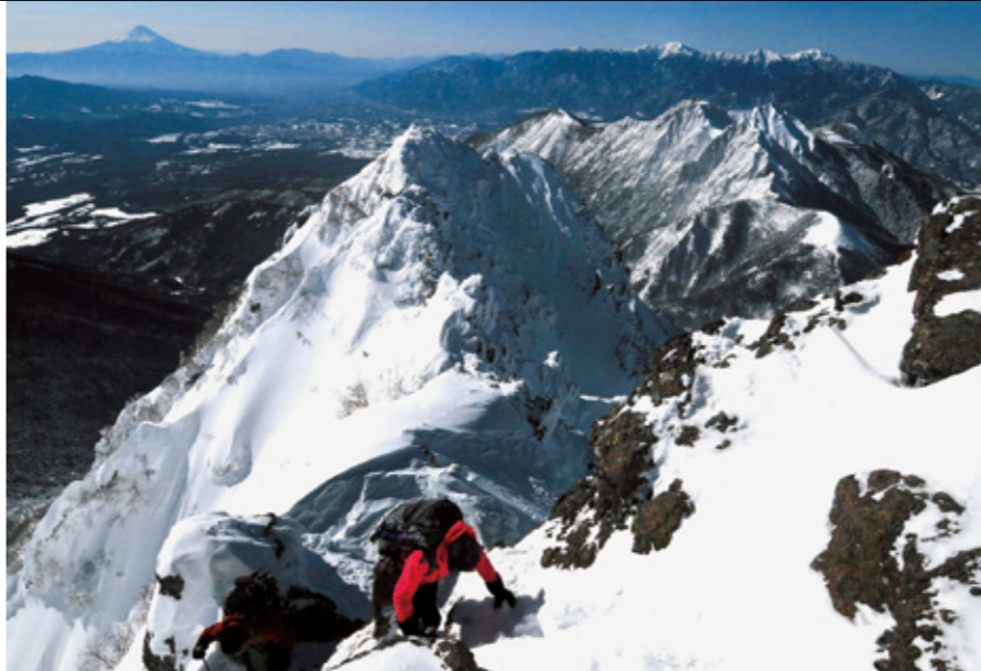
赤岳からの下りは急な雪稜なので滑落注意。不安なら後ろ向きになり手やピッケルを使う

赤岳鉱泉〜赤岳の往復など、岩稜帯でのアイゼン歩行の経験が必須。岩雪ミックス帯を危なく通過できるようにしておくこと。